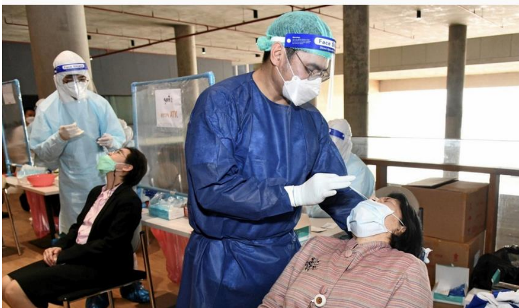
กันไว้ก่อน

เว็บไซต์ : https://www.thairath.co.th/news/politic/2280077